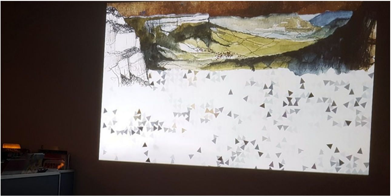
Colline 1.2 – Installation interactive par Pigment Pixel – Médiathèque de Blanquefort