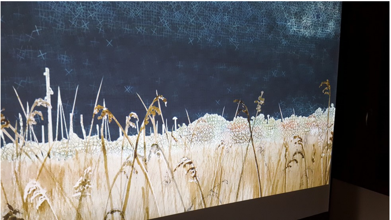
Delta Leyre 1.0 – Installation interactive par Pigment Pixel – Audenge