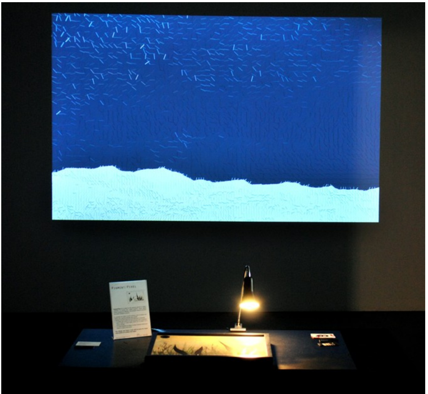
Colline 1.0 – Installation interactive par Pigment Pixel – Festival Melting Code